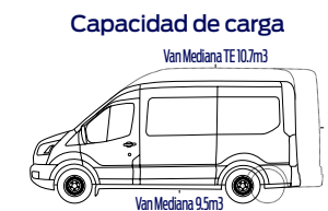
Capacidad de carga